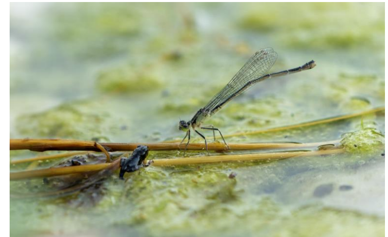
Auge in Auge: Libelle und junge Kröte